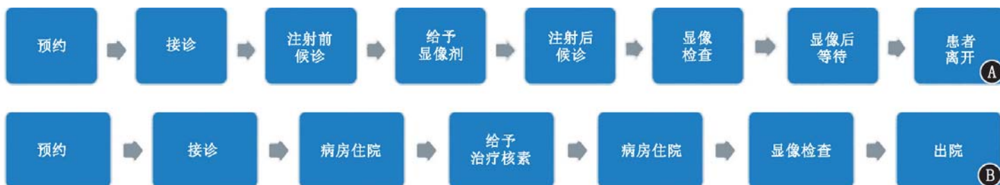
图 2 核医学诊疗流程图。A.核素显像检查流程;B.核素治疗流程